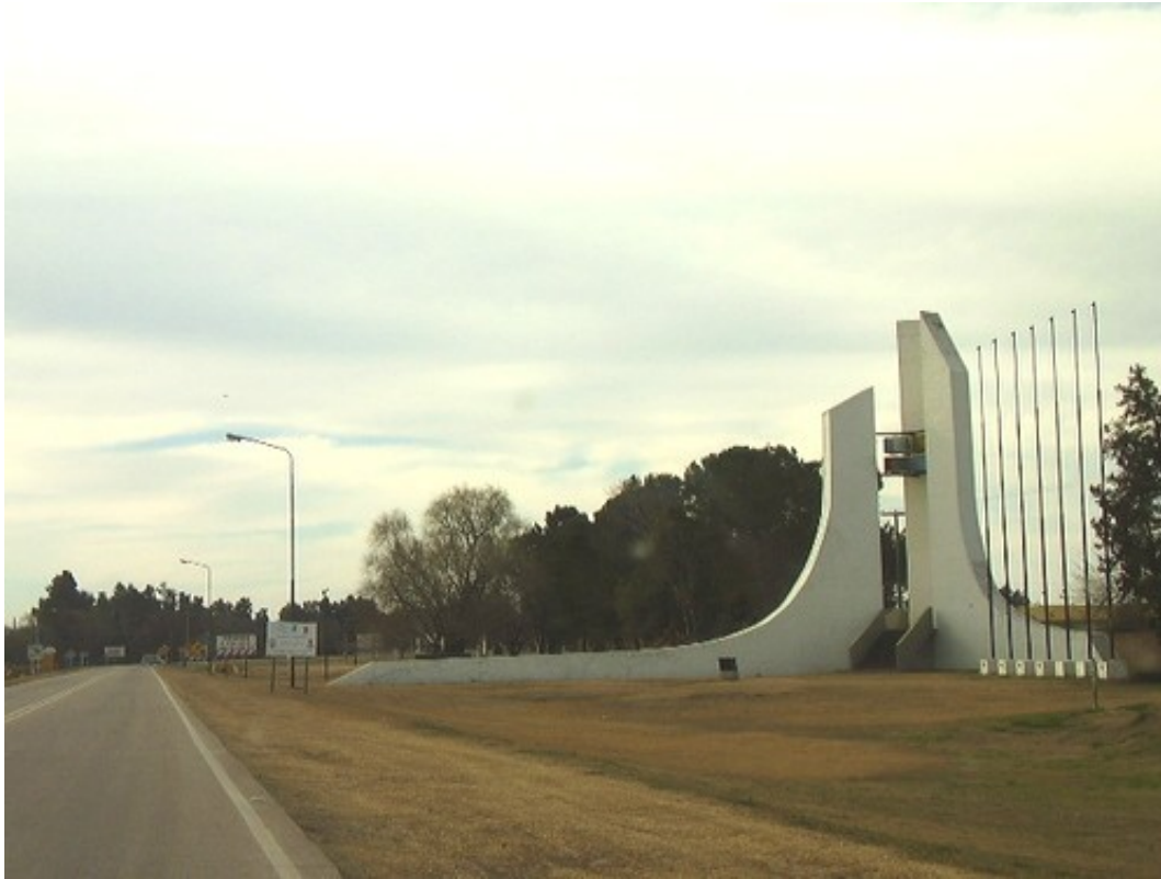
Monumento de ingreso a la ciudad