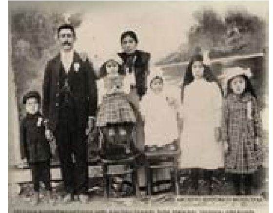
Muestra fotográfica "Testimonios de la Inmigración Italiana"