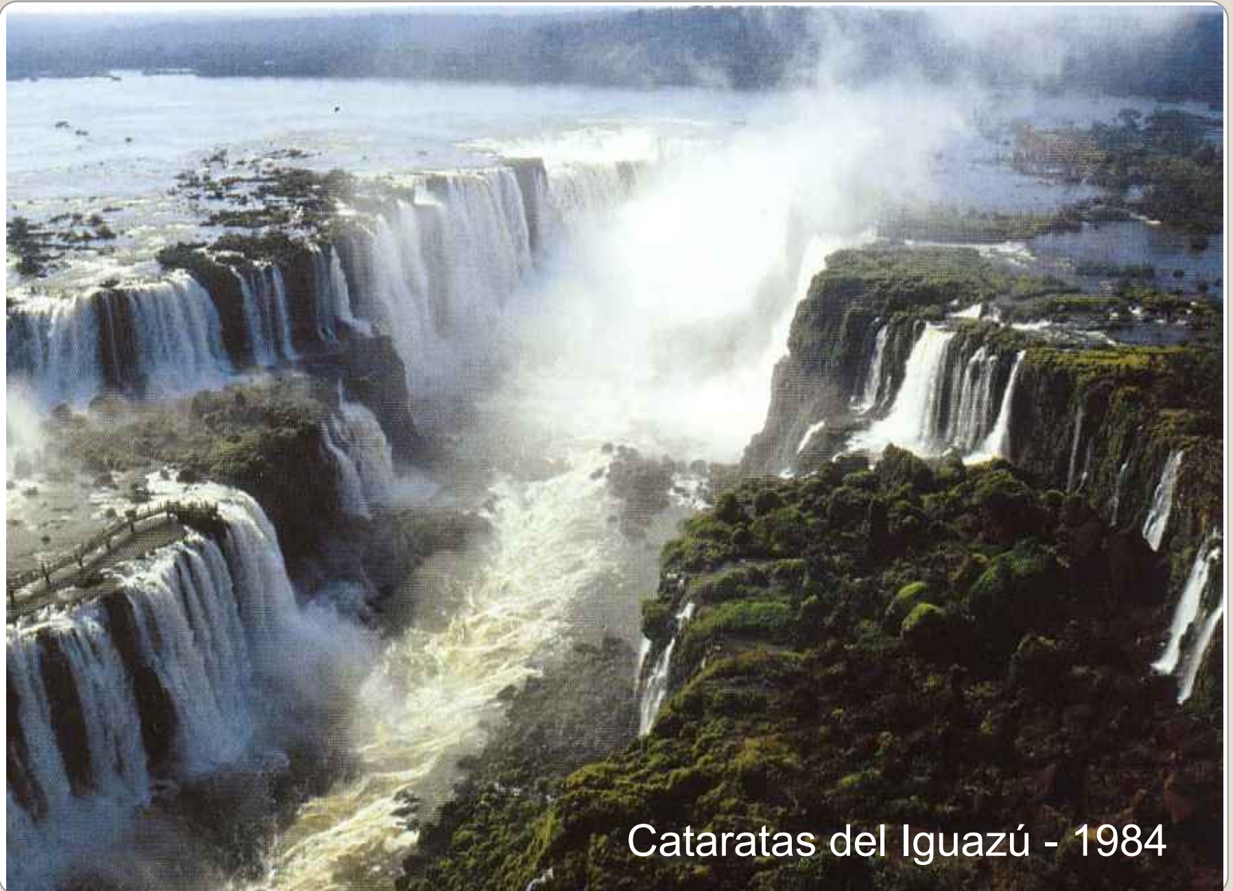
Cataratas del Iguazú - 1984