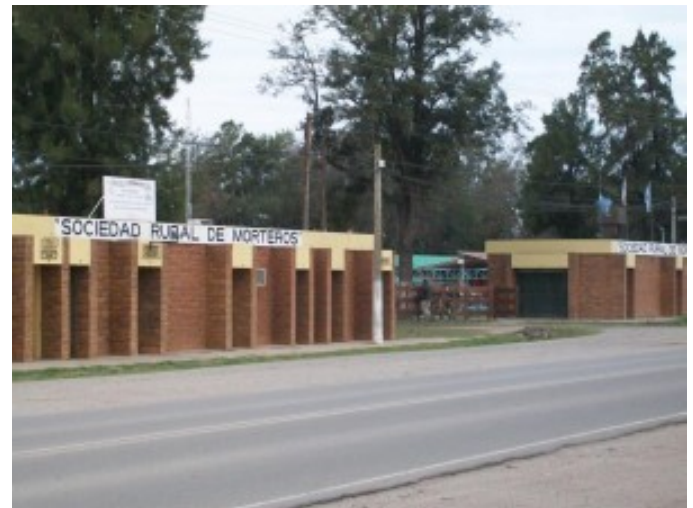
Sociedad Rural de Morteros