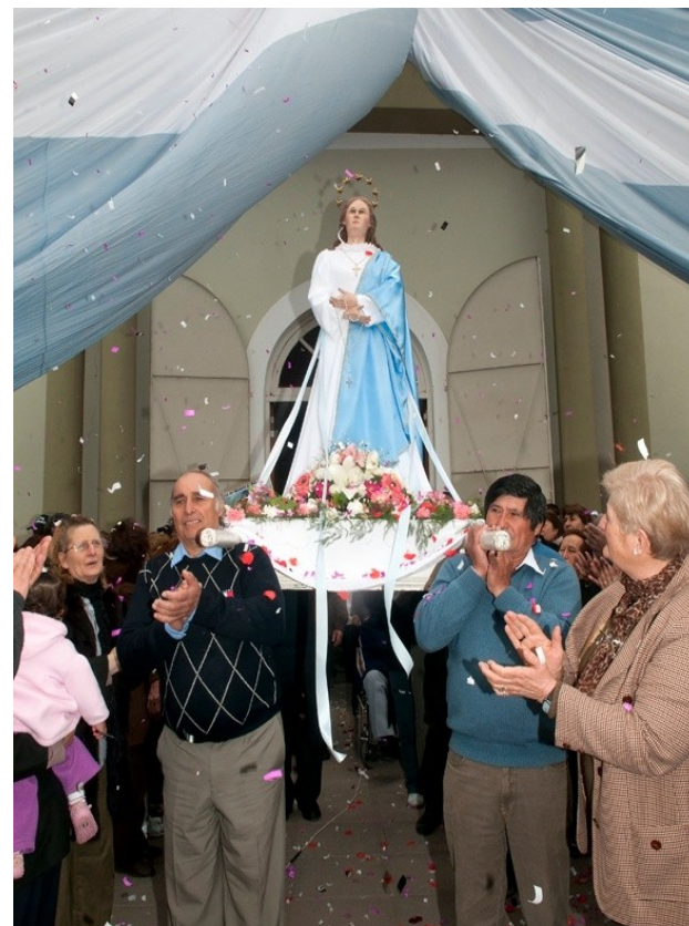
Parroquia Nuestra Señora de la Asunción