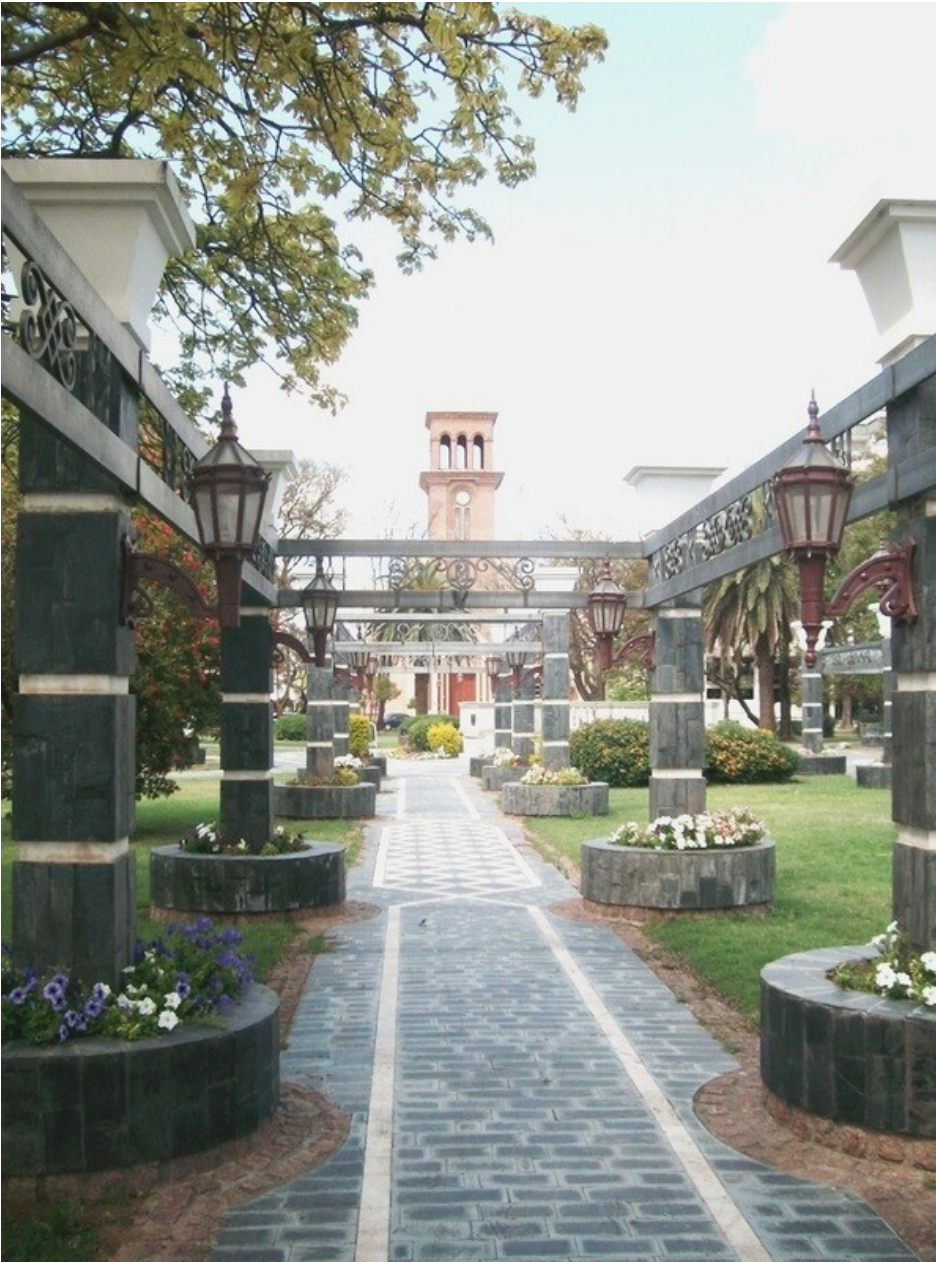
Plaza San Martín