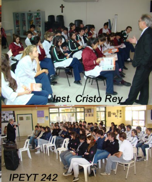
Inst. Cristo Rey