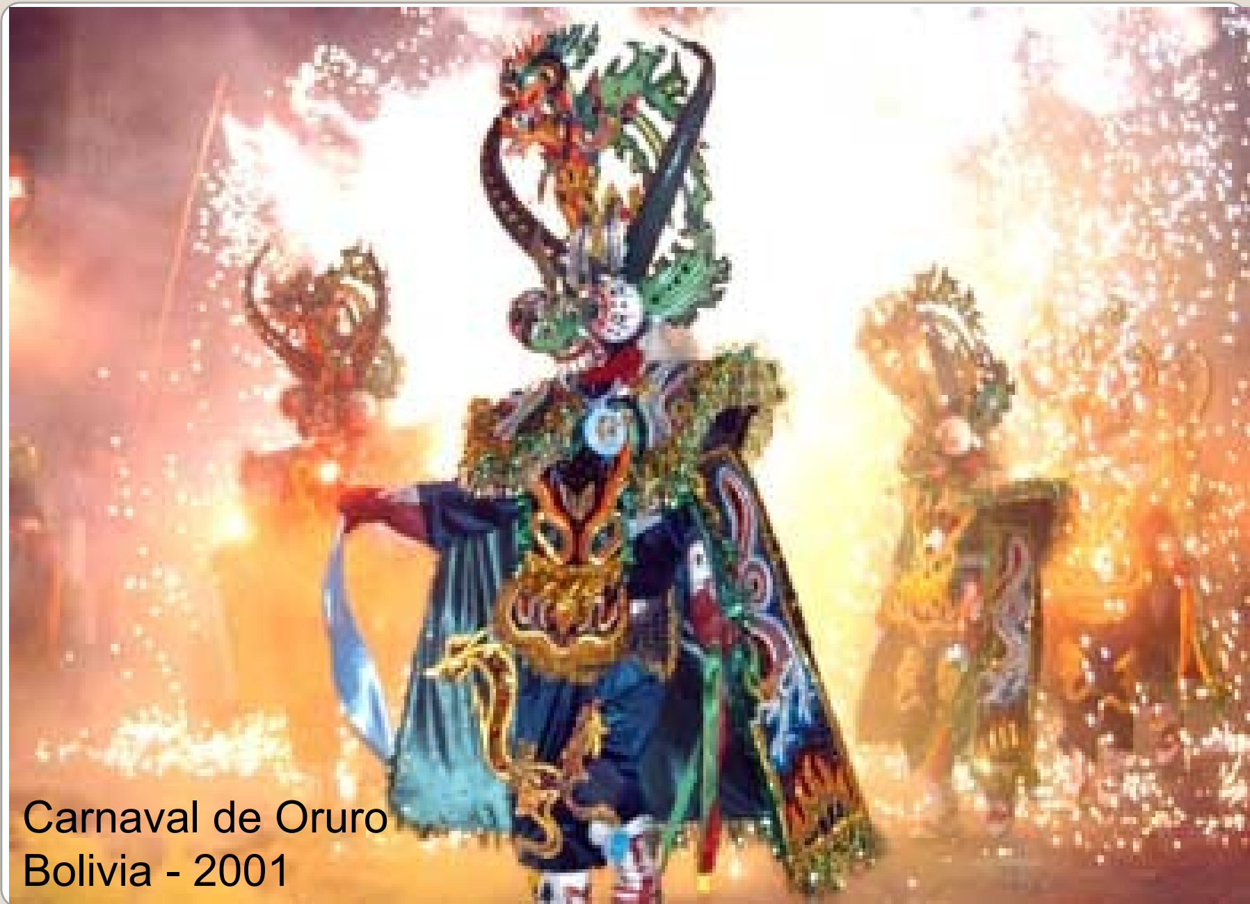
Carnaval de Oruro Bolivia - 2001