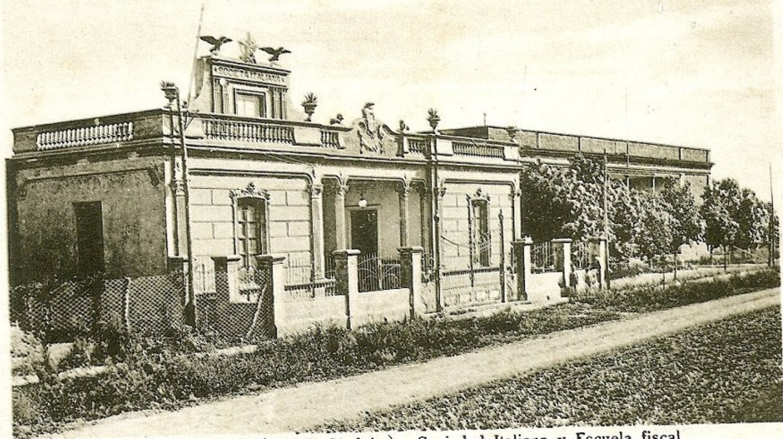
Morteros F. C. C. A. (Pcia. de Córdoba). Sociedad Italiana y Escuela fiscal