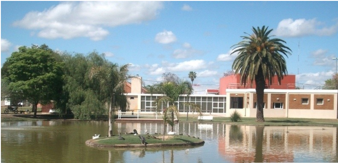
Lago de Morteros