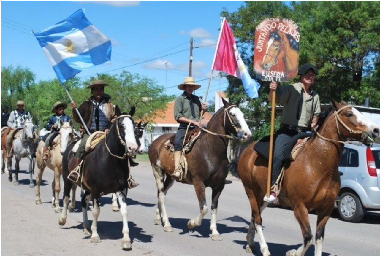
Día de la Tradición