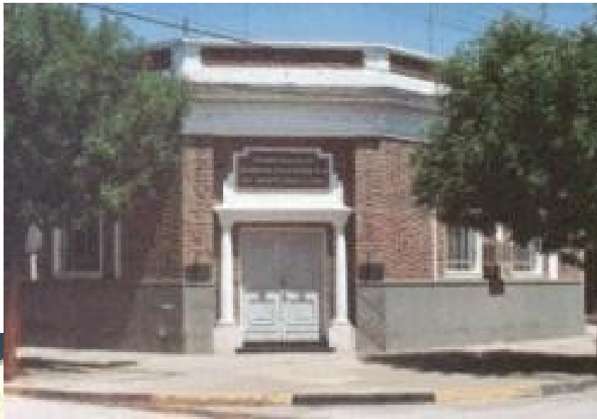
Cooperativa Agrícola de Morteros