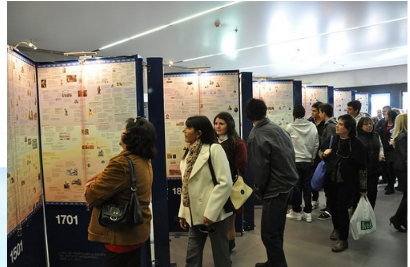
Muestra Histórica “Línea de tiempo en la ocupación del espacio argentino y cordobés”