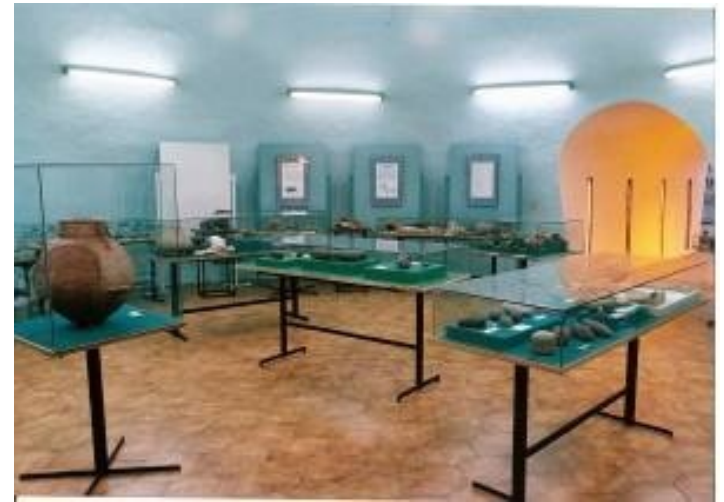
Sala de Paleontología, Arqueología y Antropología . Objetos de los pueblos originarios de la región.