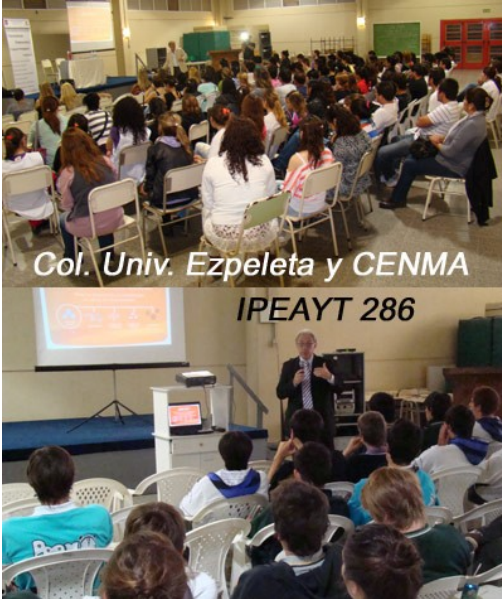
Col. Univ. Ezpeleta y CENMA IPEAYT 286