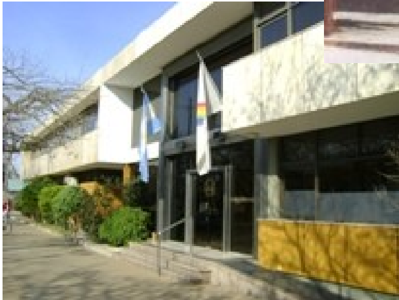
Cooperativa de Servicios Públicos de Morteros