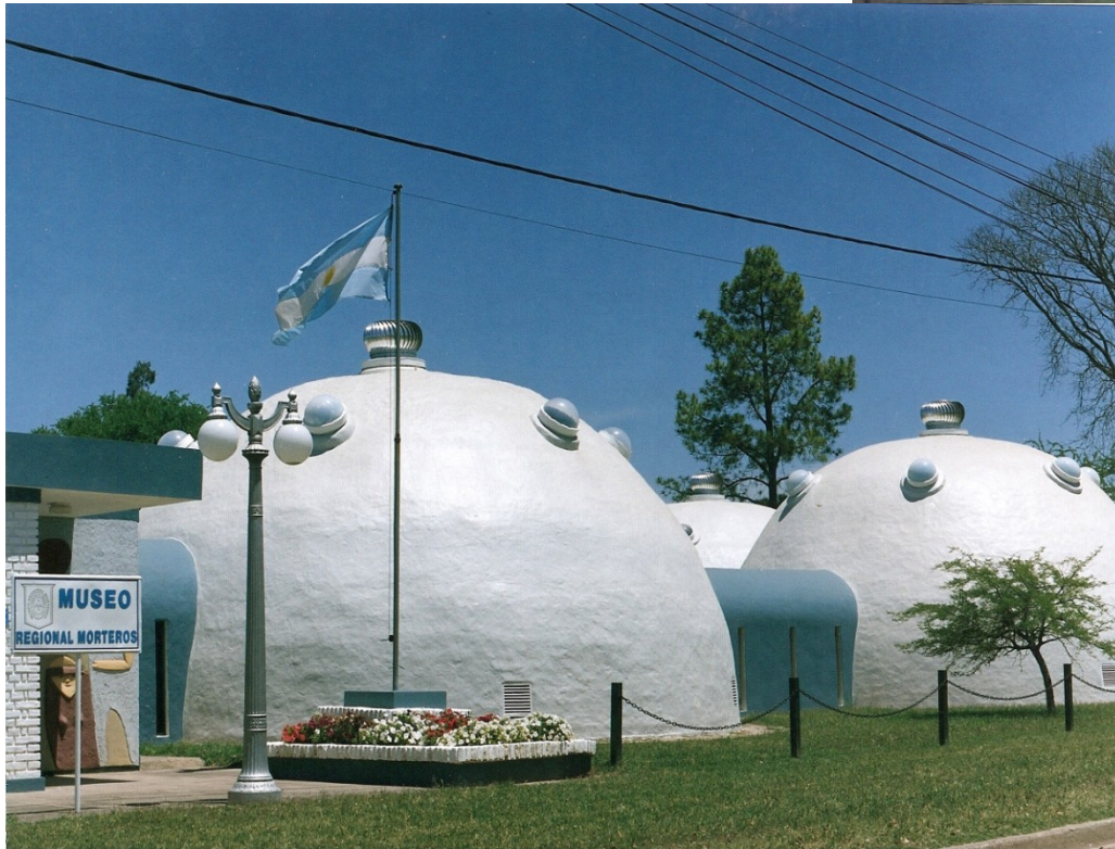
Museo Regional Morteros