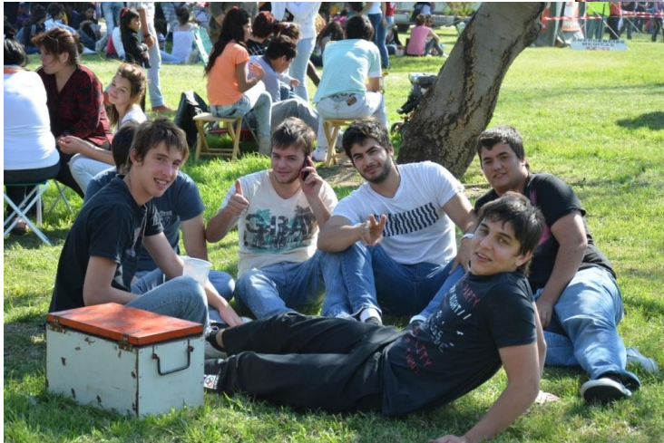
Fiesta Regional de la Primavera