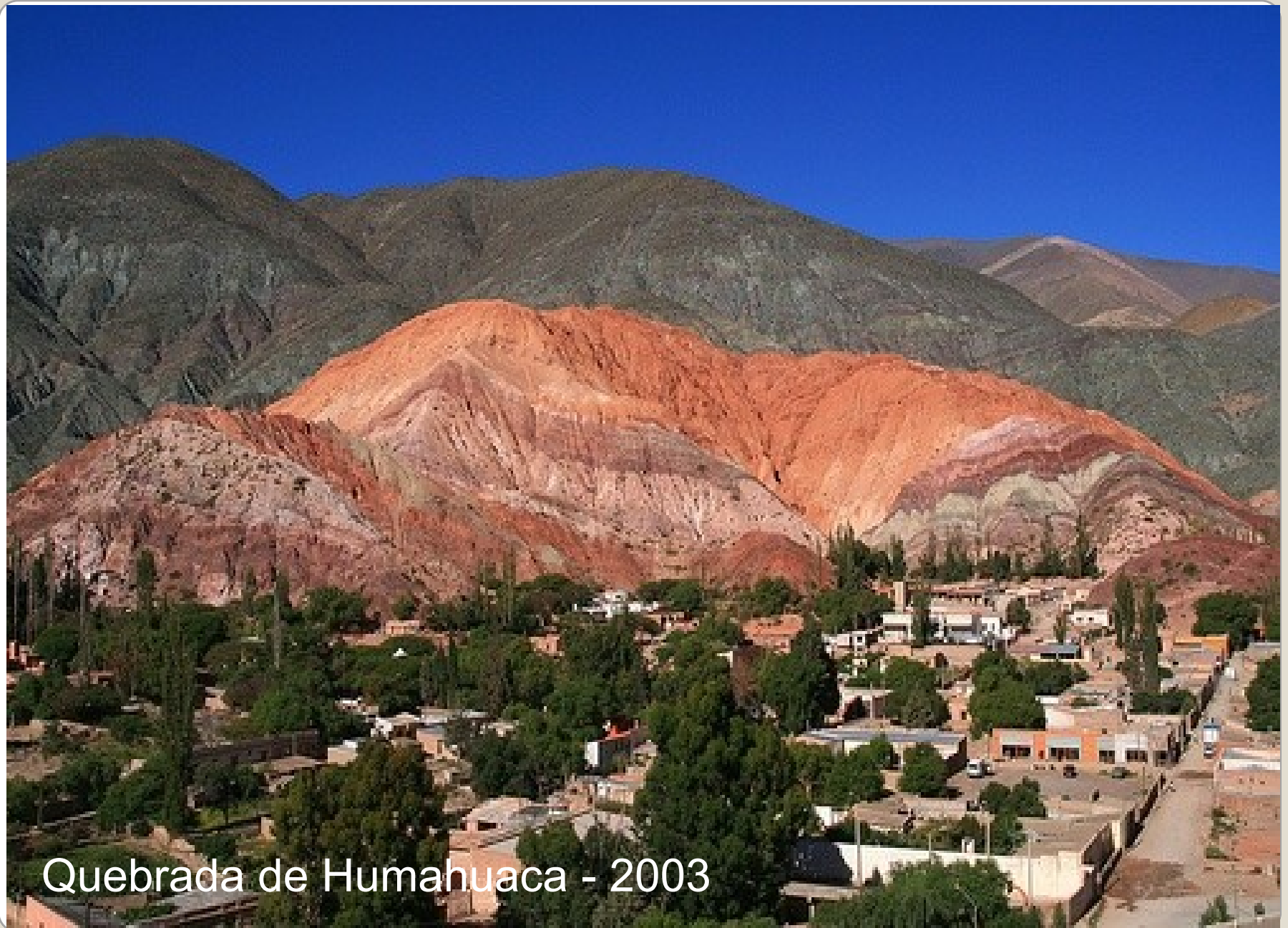
Quebrada de Humahuaca - 2003