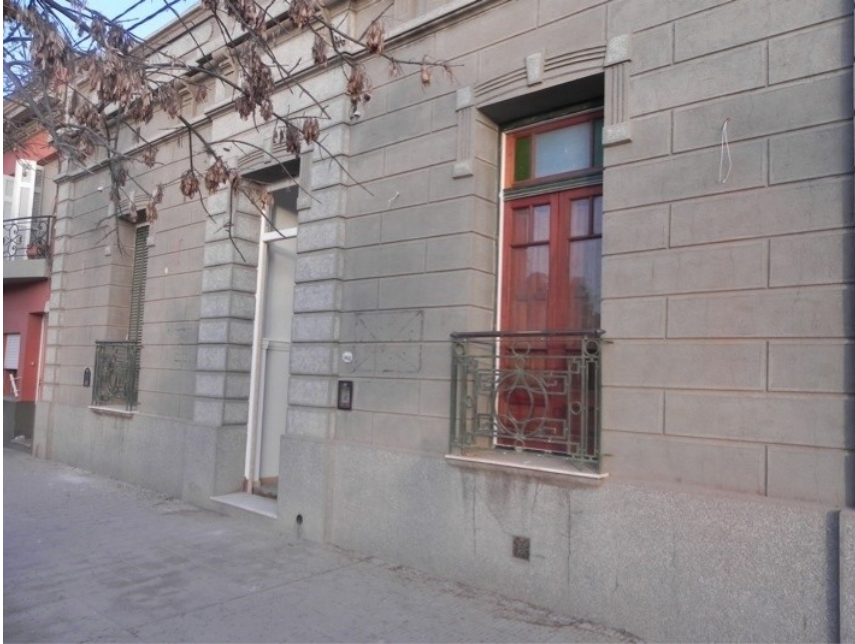
Casona histórica Biblioteca Popular Registro Civil