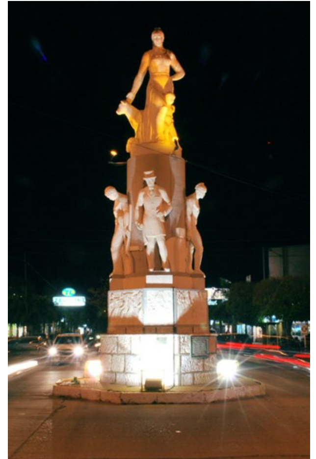
Monumento a la Madre Tierra