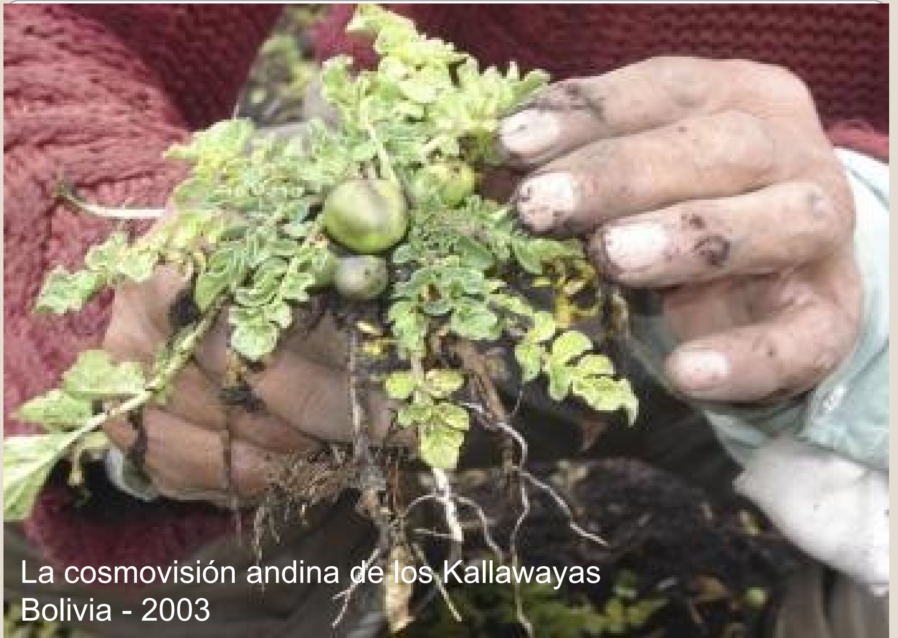
La cosmovisión andina de los Kallawayas Bolivia - 2003