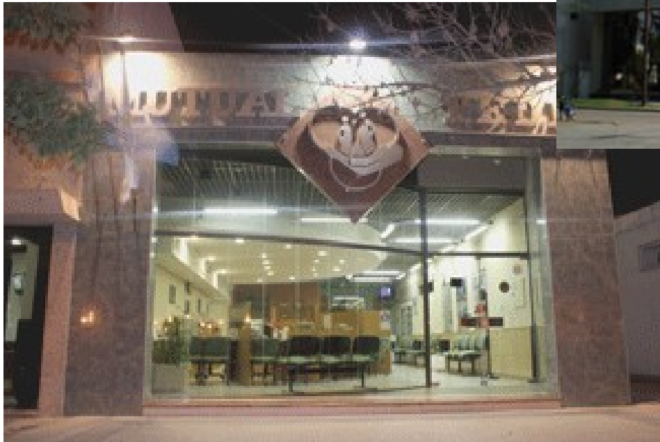
Mutual Tiro Federal y Deportivo Morteros