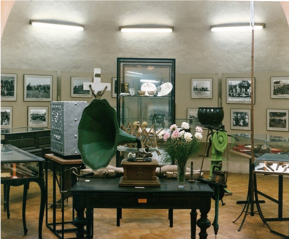
Sala de Historia. Piezas, utensilios y fotografías de los inmigrantes colonizadores de la región.