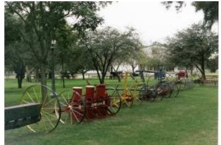
Exposición de maquinarias agrícolas y carruajes antiguos.