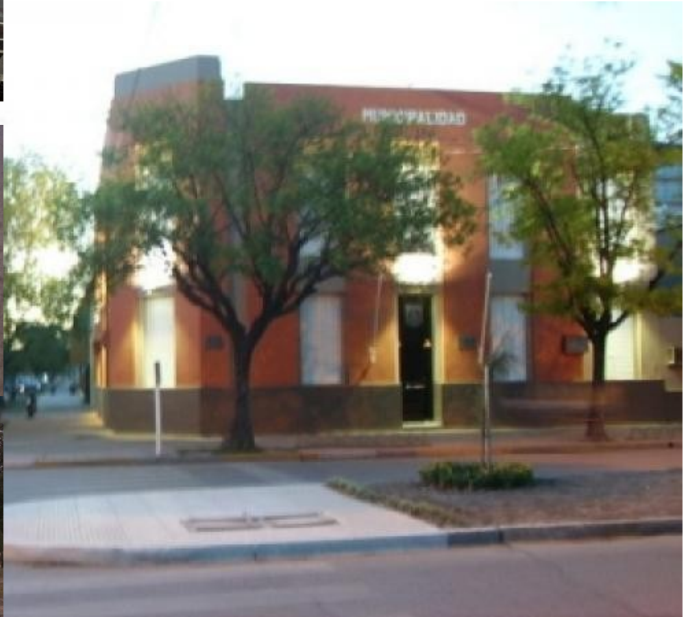
Municipalidad de Morteros