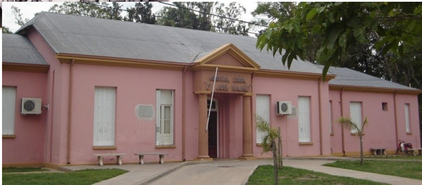
Hospital Municipal Dr. José Sauret