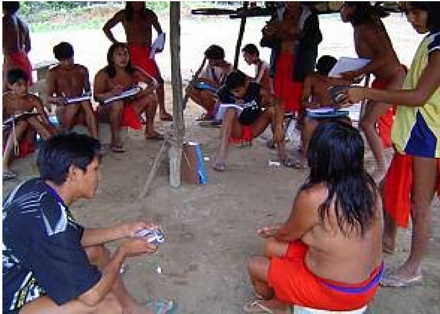
Las expresiones orales y gráficas de los wajapi Brasil - 2003