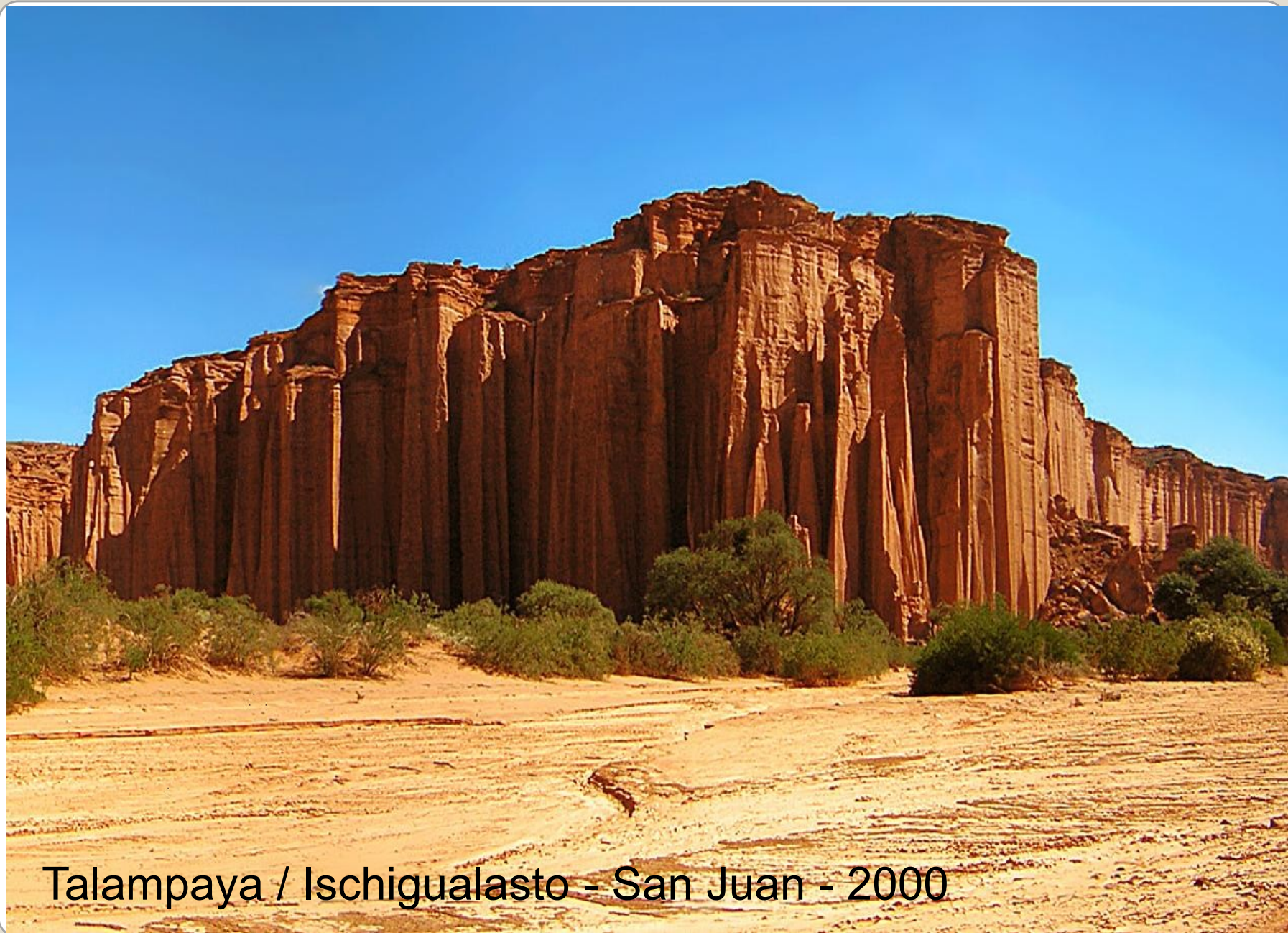
Talampaya / Ischigualasto - San Juan - 2000