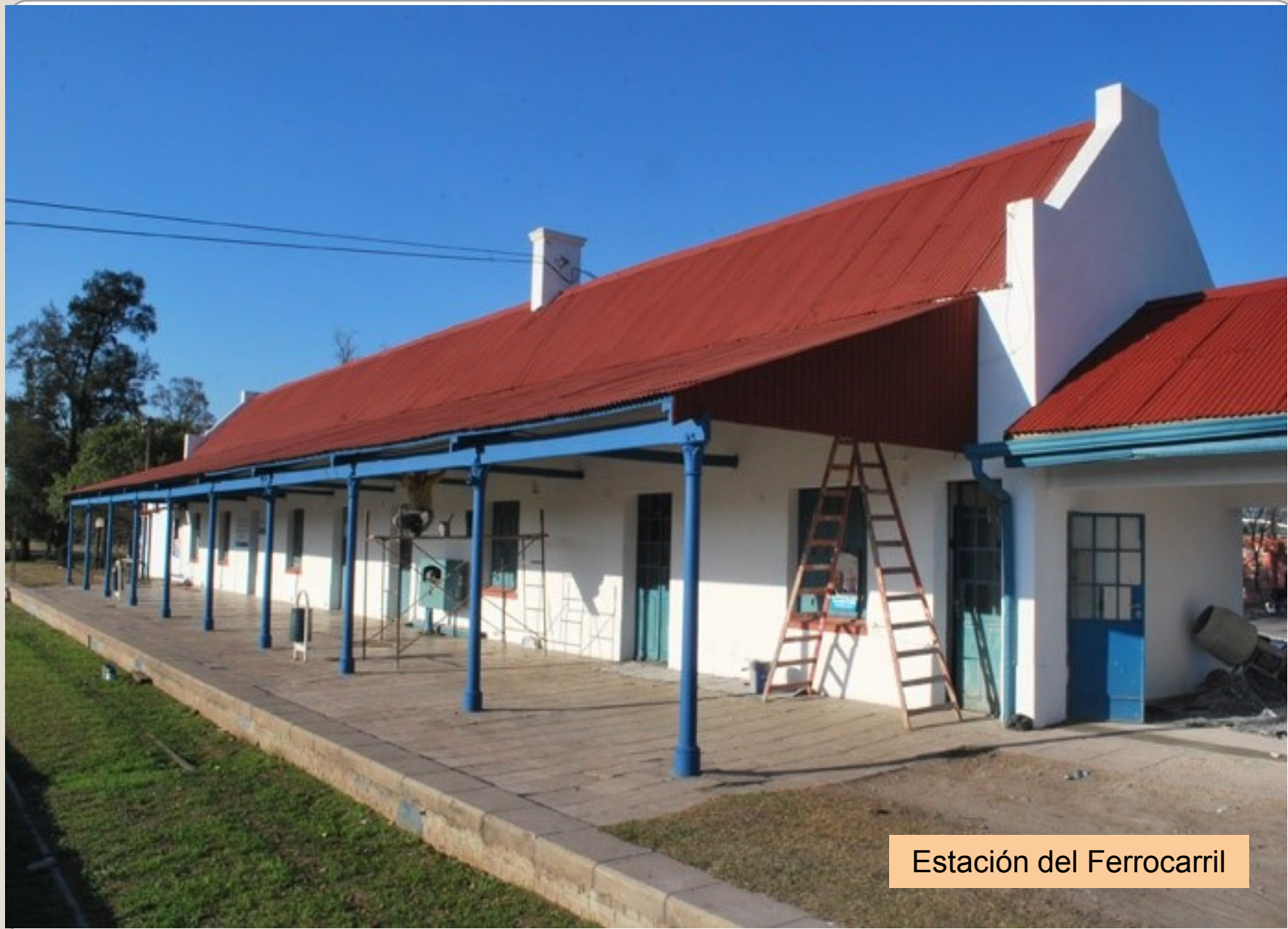
Estación del Ferrocarril