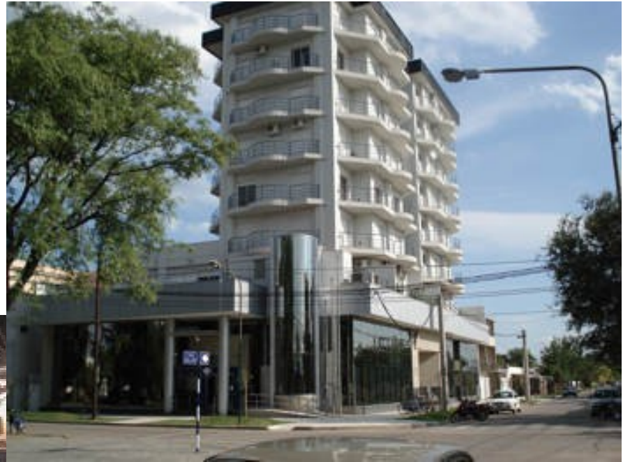
Mutual Club 9 de Julio